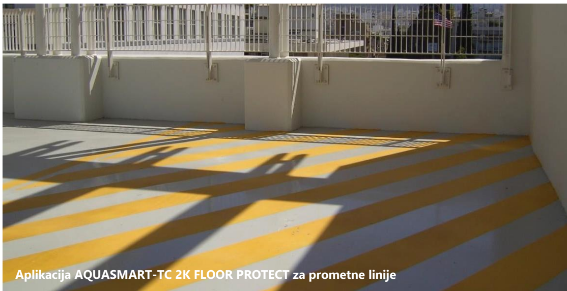
Aplikacija AQUASMART-TC 2K FLOOR PROTECT za prometne linije

Lagani pješački promet može se dopustiti nakon 24 sata. Promet vozilima trebao bi biti dopušten tek nakon 5 dana od nanošenja završnog sloja.