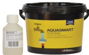
AQUASMART-TC 2K FLOOR PROTECT